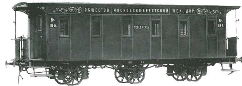
Вагон 3-го класса

Камчатские епархиальные ведомости. Благовещенск. 1987. №15. С. 313-314.