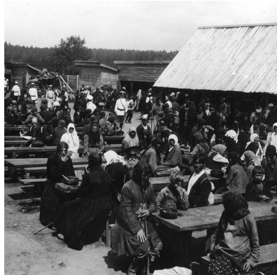
Торжества в Сарове, 1903