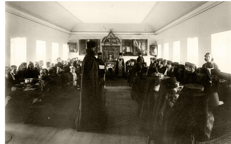
Обед в трапезной Коневского Рождество-Богородичного монастыря. 1896 год