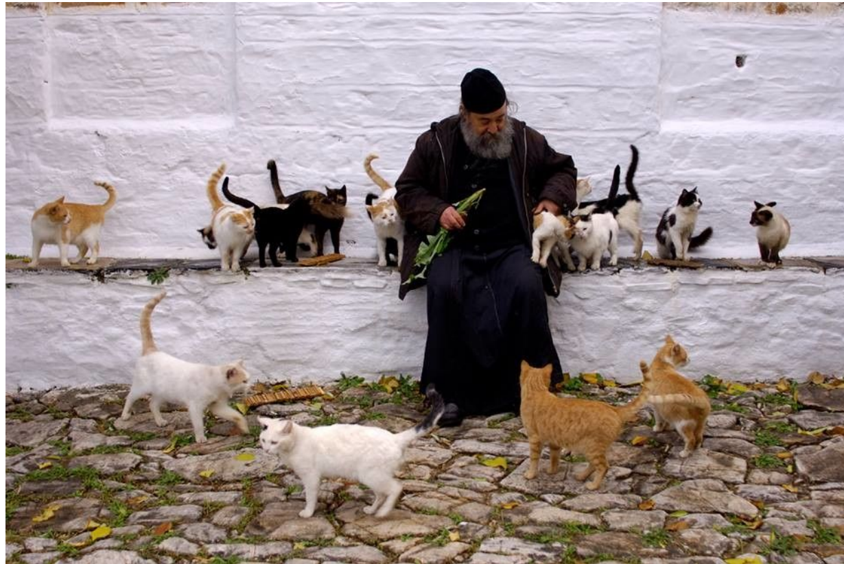
Коты святой горы Афон