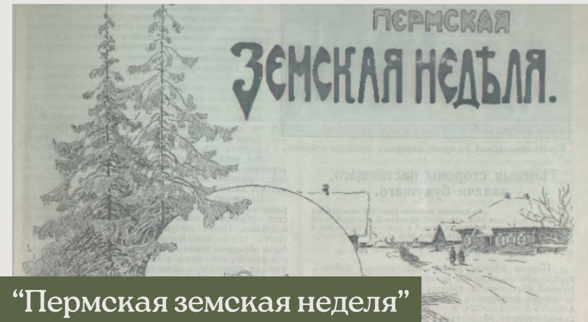
“Пермская земская неделя”