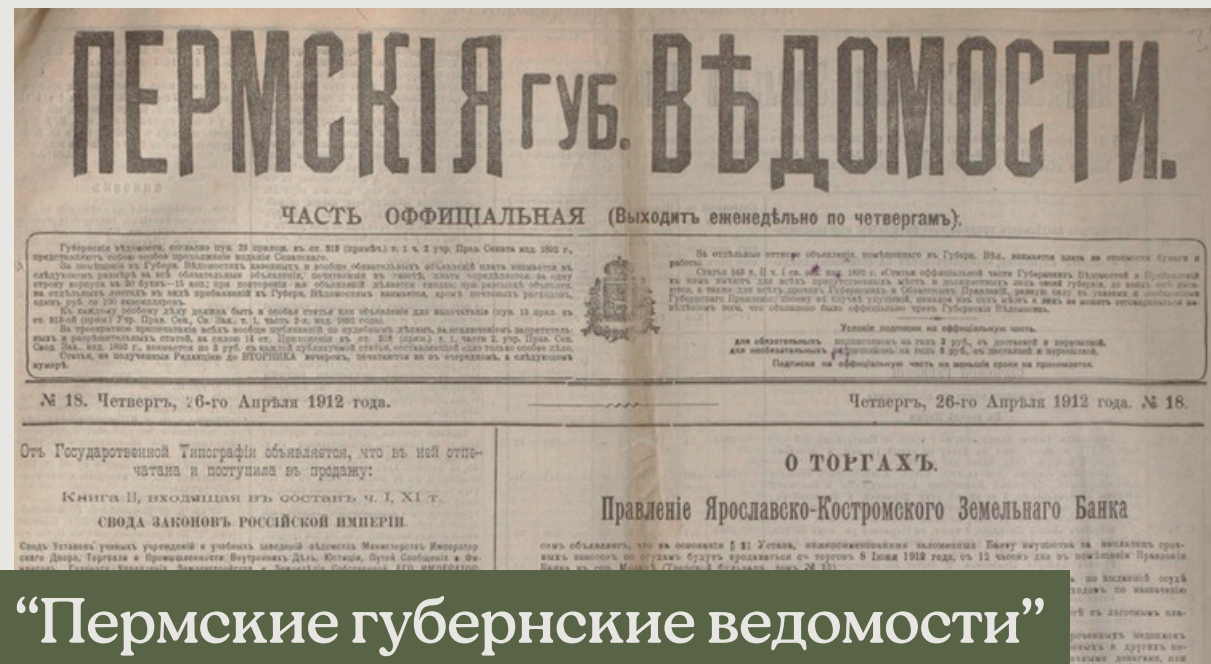
“Пермские губернские ведомости”