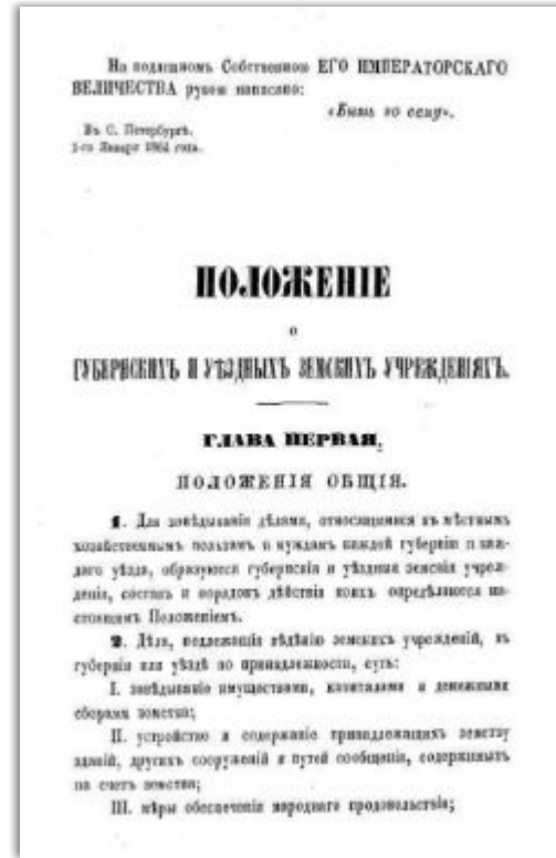
« Положение о губернских и уездных земских учреждениях » — законодательный акт