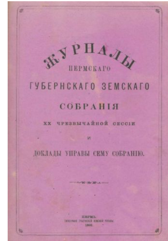
Информационная система " Журналы земских собраний как источник изучения истории местного самоуправления в России (II половина XIX - начало XX века)".