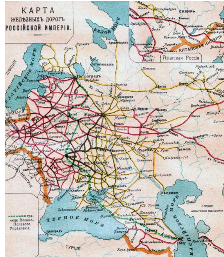
Карта железных дорог Российской империи

На этот период пришелся расцвет паломничества в Российской империи вследствие модернизации транспорта и ряда других факторов.