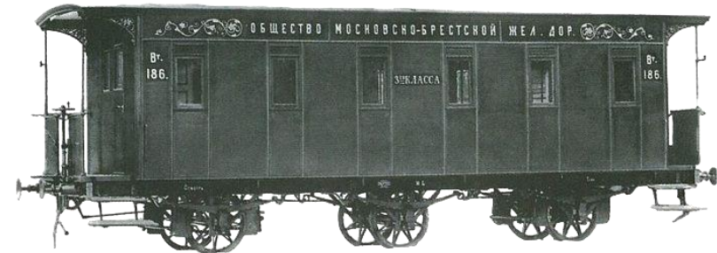
Вагон 3-го класса

Камчатские епархиальные ведомости. Благовещенск. 1987. №15. С. 313-314.