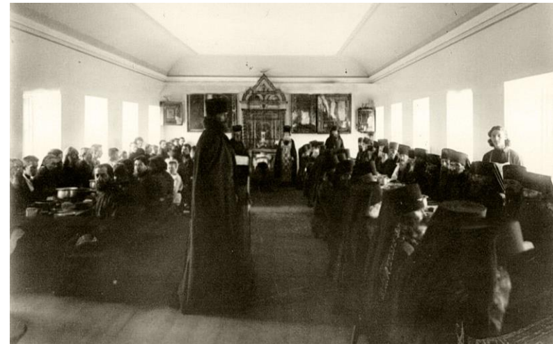
Обед в трапезной Коневского Рождество-Богородичного монастыря. 1896 год