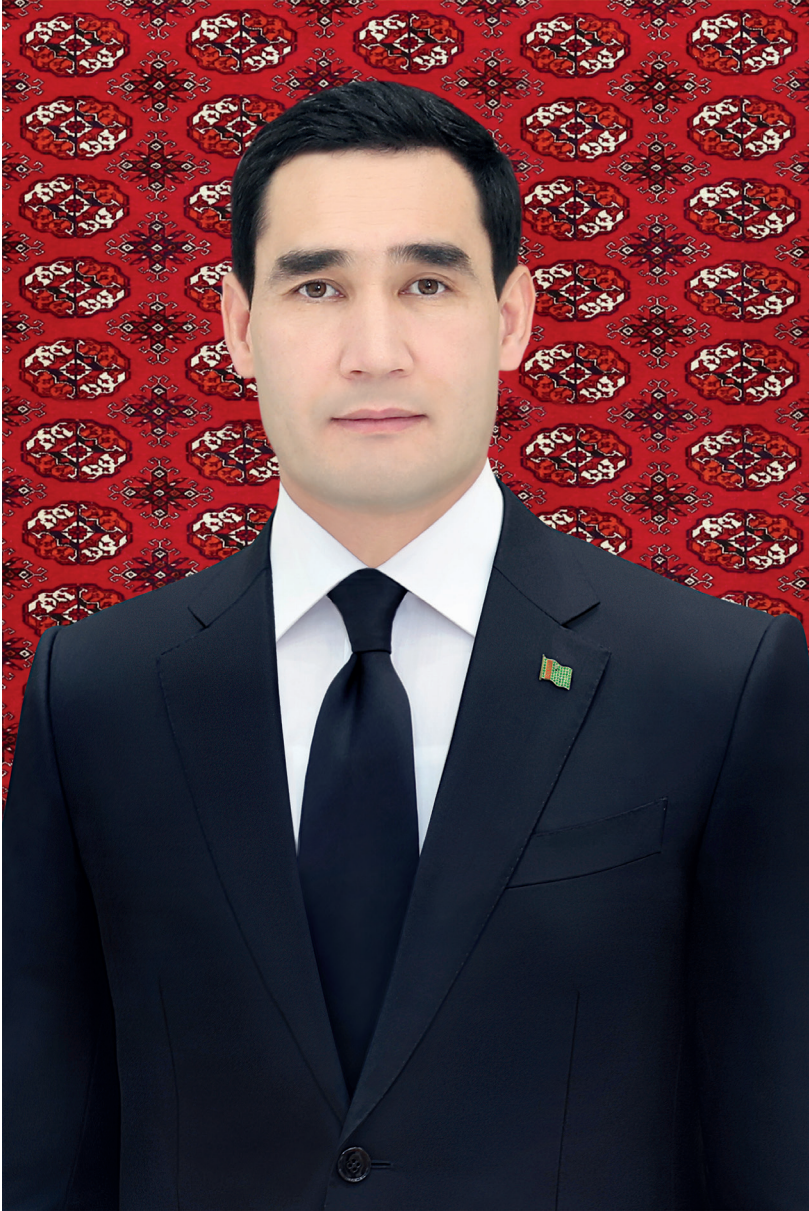
TÜRKMENISTANYŇ PREZIDENTI SERDAR BERDIMUHAMEDOW