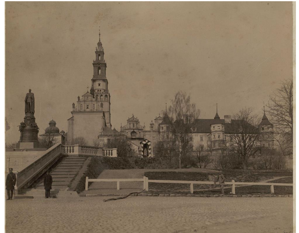
Памятник Александру II. Ченстохов. Открытка кон. XIX – нач. XX вв.