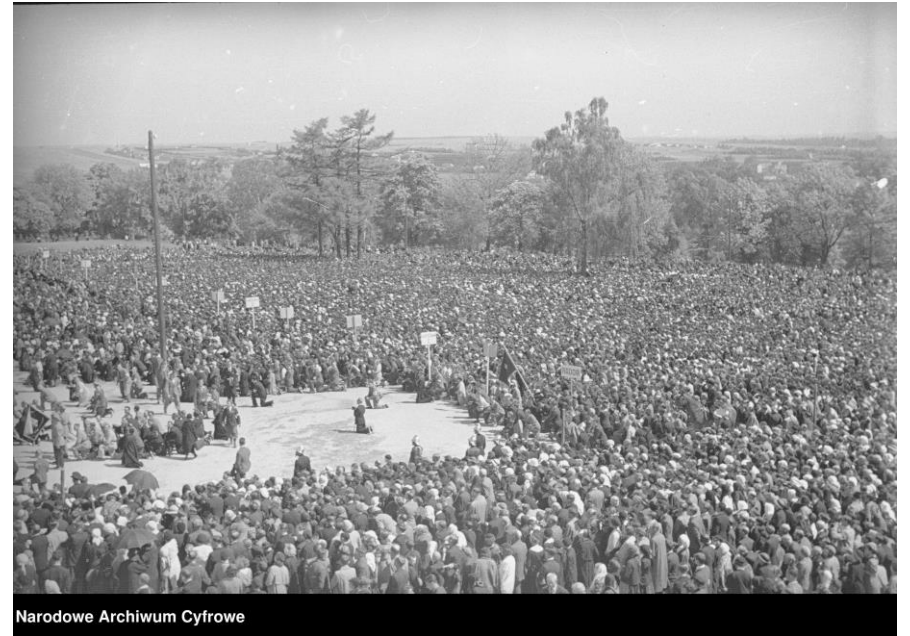
Паломники в Ченстохове. 1928-1936 гг.

«Несколько лет тому назад была скандальная профанация таинства исповеди в один из дней общих паломничеств. В одну из внешних будок забрался еврей, переодетый ксёндзом , аккуратно остриженный и выбритый ».