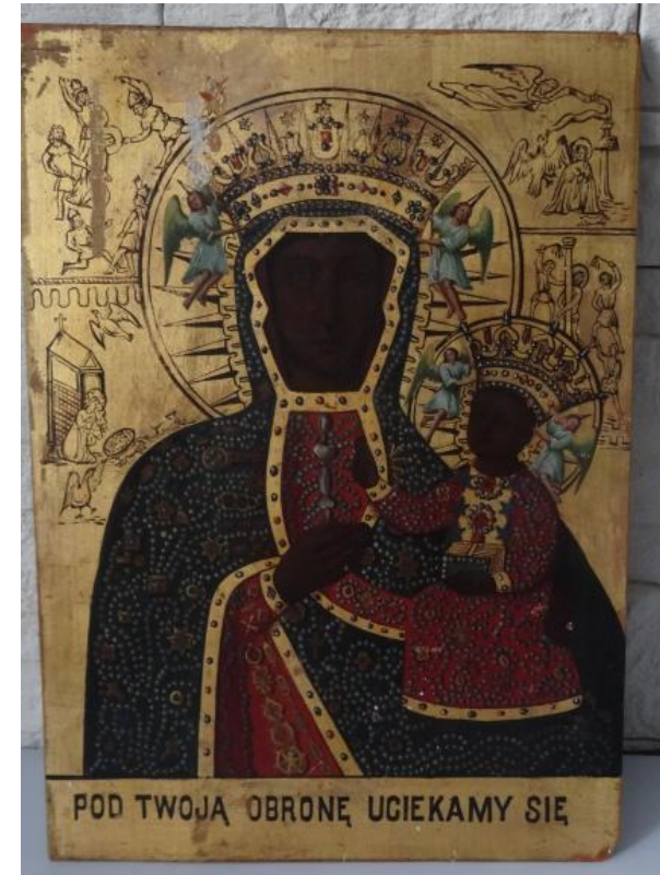
Икона Ченстоховской Божьей матери (Умягчение злых сердец). Живопись XIX в.

«На месте своей стоянки редкая партия не оставит (на обратном пути обыкновенно) какой-нибудь иконы, выдолбленной в вековую сосну или не поставит хоть небольшого креста у источника . Таким образом, с течением времени места эти становятся священными и историческими, на подобие крестов, существовавших в крае со времени иезуитских миссий».