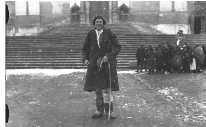
Фото 1. Паломники в Ченстохове. 1928-1936 гг.