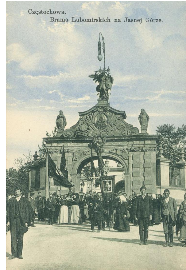
Любомирские ворота на Ясной горе. 1900-1928.