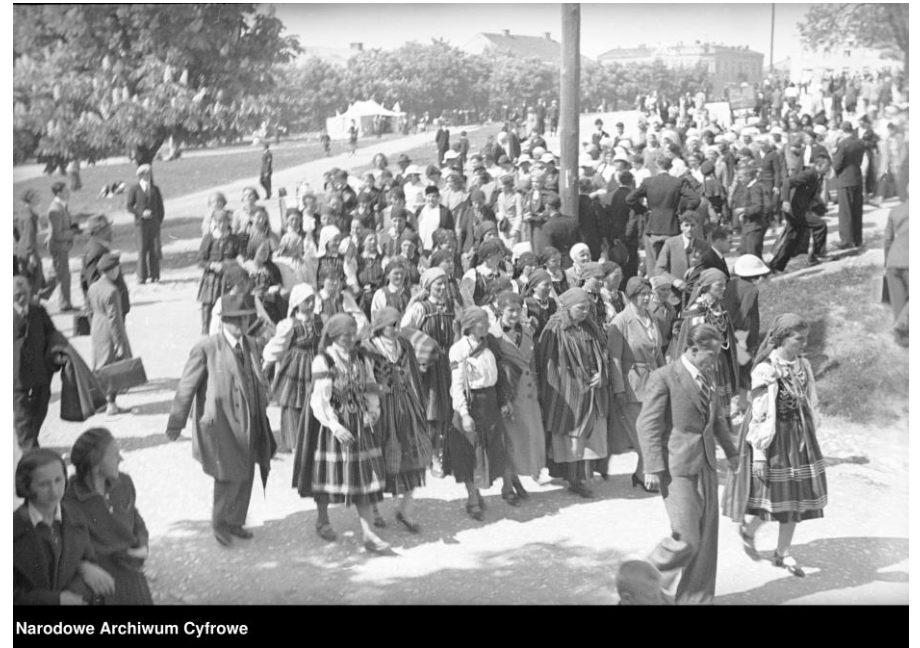
Паломники в Ченстохове. 1928-1936 гг.