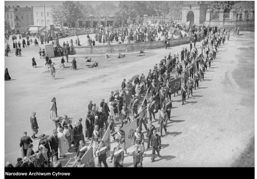
Паломники в Ченстохове. 1928-1936 гг.