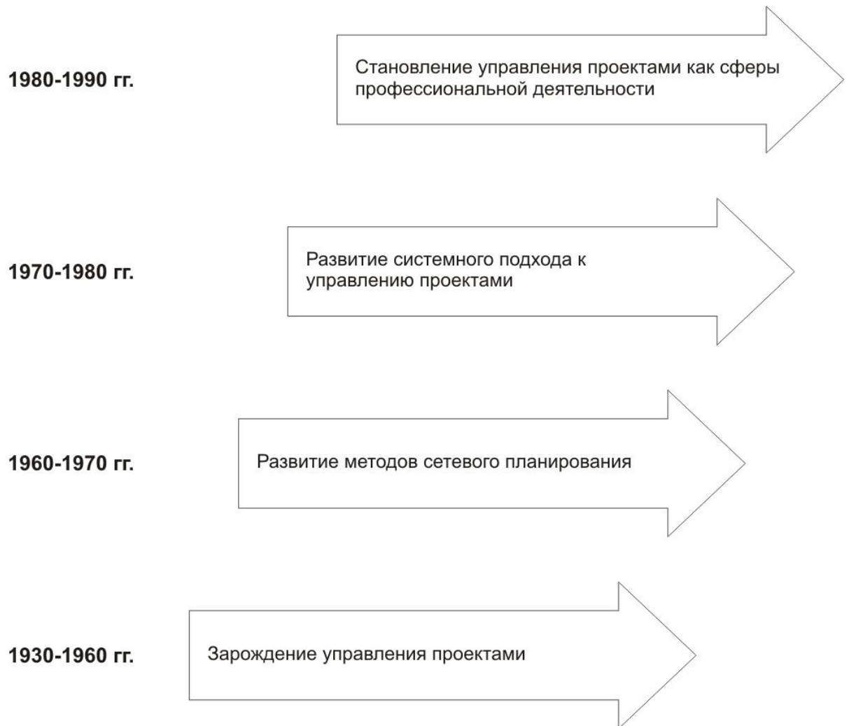
Рис. 1. Основные этапы развития управления проектами