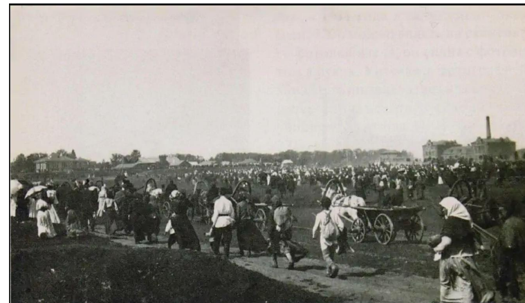
Крестные ходы в Тобольске. 1910-е годы