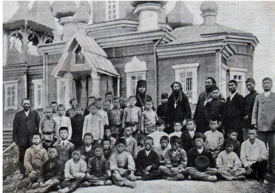
Паломники-ученики. Русские и корейцы. 1905 г.

Таким образом, можно сказать, что корейцы старались ассимилироваться с русским населением, принимая участие в религиозных практиках.