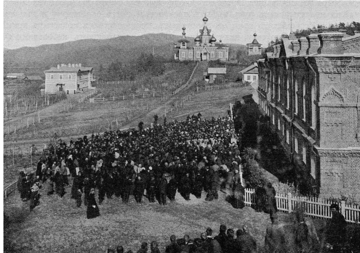
Свято-Троицкий Николаевский Монастырь, н. XX в.

«по возвращении с пасеки курсисты стали готовиться к предстоящему Богослужению. С 6 ч. вечера и до 11 ночи продолжалось торжественное всенощное бдение. Пели на два хора монахи и курсисты. <...> На следующий день после Литургии курсистам был предложен обед в общей трапезной вместе с братией»