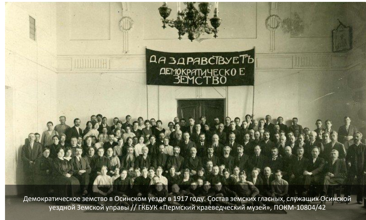
Демократическое земство в Осинском уезде в 1917 году. Состав земских гласных, служащих Осинской уездной Земской управы // ГБУК «Пермский краеведческий музей», ПОКМ-10804/42