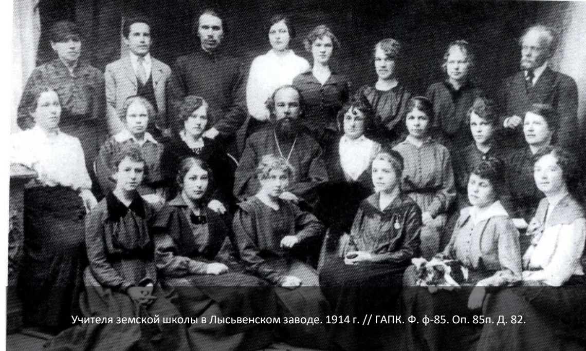
Учителя земской школы в Лысьвенском заводе. 1914 г. // ГАПК. Ф. ф-85. Оп. 85п. Д. 82.