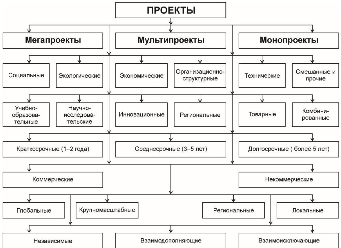
Рис. 1. Классификация проектов