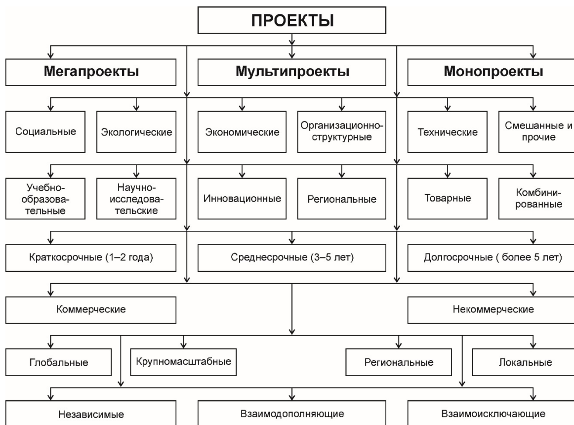
Рис. 1. Классификация проектов