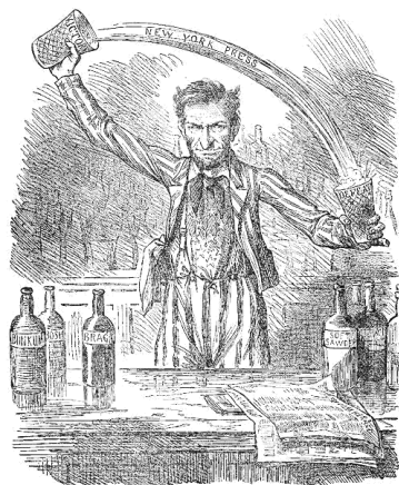
Рис. 2. Карикатура на Линкольна А. 1862 г. [Wilson, 1903, p.12].