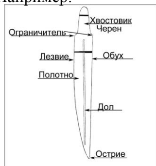
Рис.1. Конструкция должного ножа эпохи Великого переселения народов в Прикамье