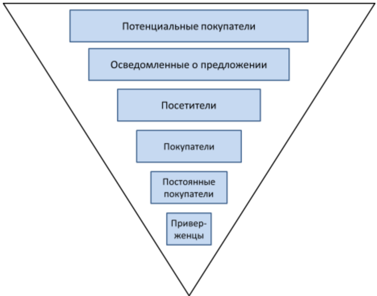
Рис. 1. Группировка потребителей по воронке продаж

Пример оформления приложения с двумя структурными элементами