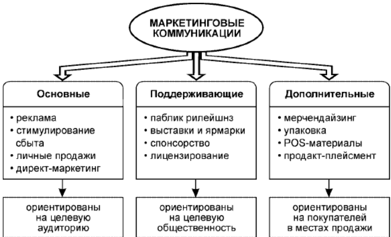
Рис. 1. Классификация маркетинговых коммуникаций