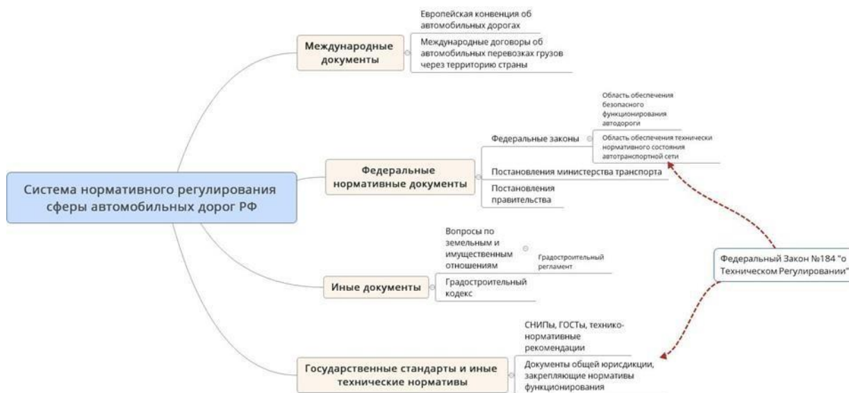
Рис. 1. Система нормативных актов, регулирующая сферу обеспечения