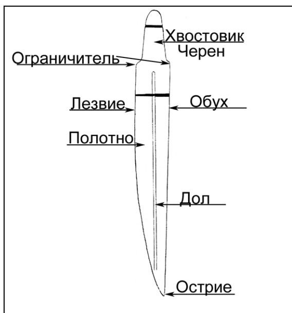
Рис.1. Конструкция долowego ножа эпохи Великого переселения народов в Прикамье