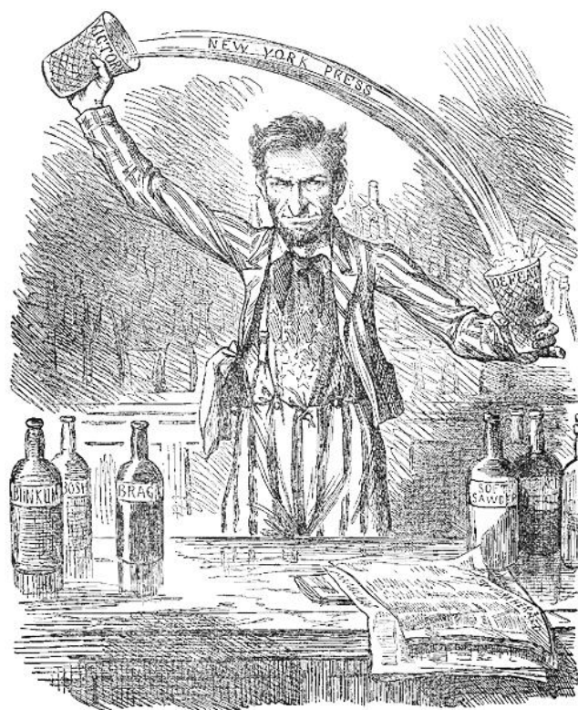
Рис.2. Карикатура на Линкольна А. 1862 г. [Wilson, 1903, p.12].