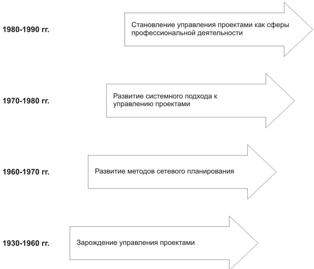
Рис. 1. Основные этапы развития управления проектами