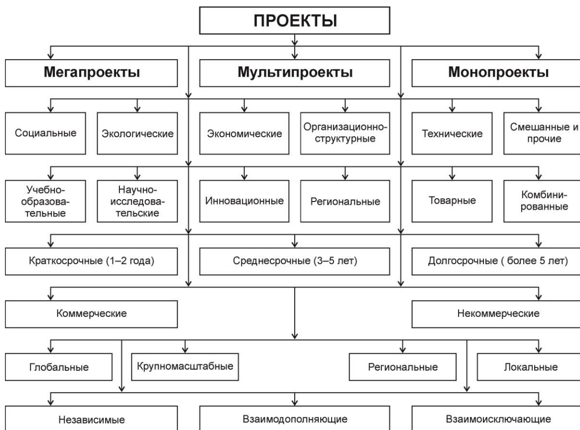
Рис. 1. Классификация проектов