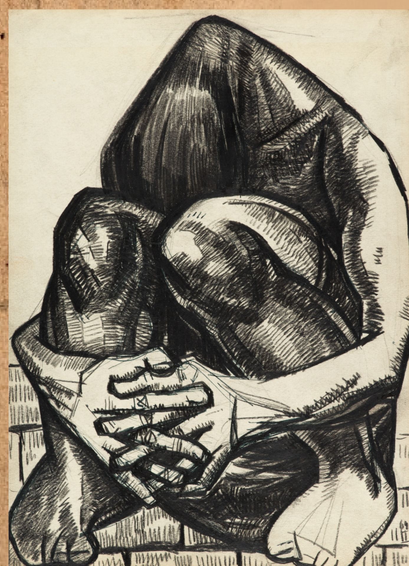
Рисунок А. Д. Тихомирова «Узник». ФТ

В начале октября 1944 г. в Аушвице было 2 510 мальчиков и девочек. 10 января 1945 г. их оставалось 611.