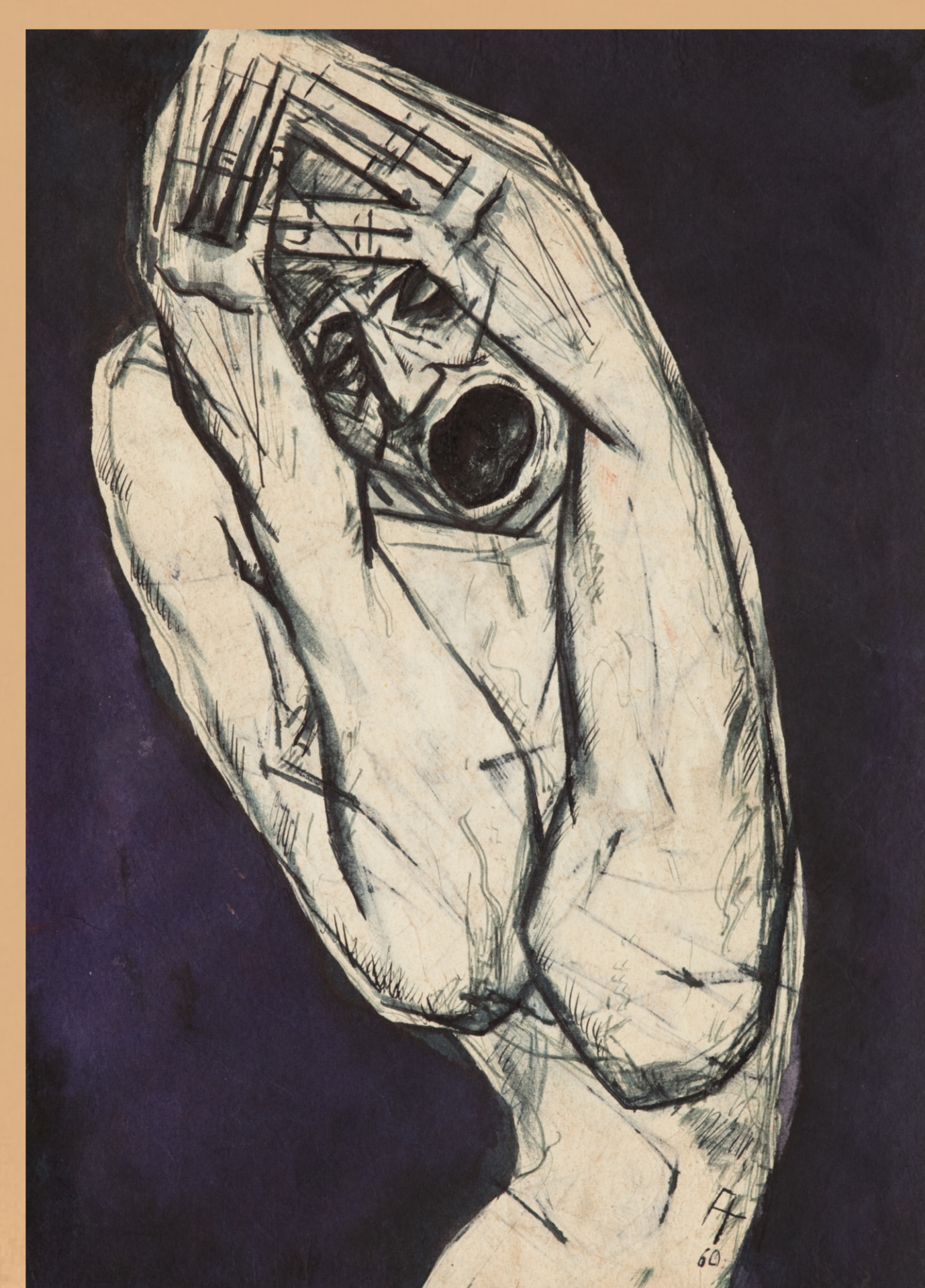
Рисунок А. Д. Тихомирова «Крик». ФТ