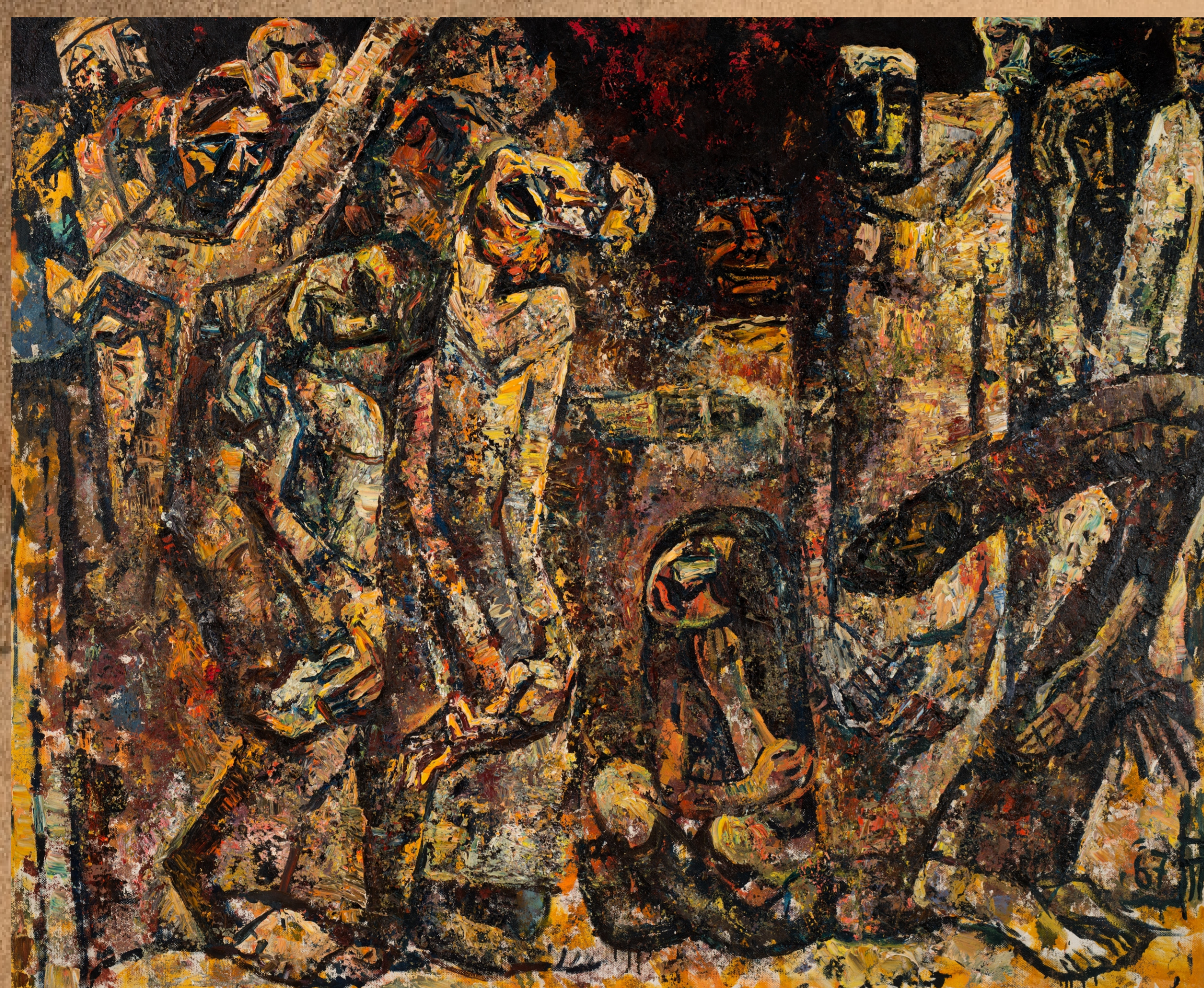
Рисунок А. Д. Тихомирова «Освенцим». ФТ

Аушвиц выполнял две функции: концлагерь для людей разных национальностей и место уничтожения евреев с помощью газовых камер и крематориев. Впервые убийство газом «Циклон - Б» было опробовано на нескольких тысячах советских военнопленных. Всего было уничтожено около 1 миллиона узников.