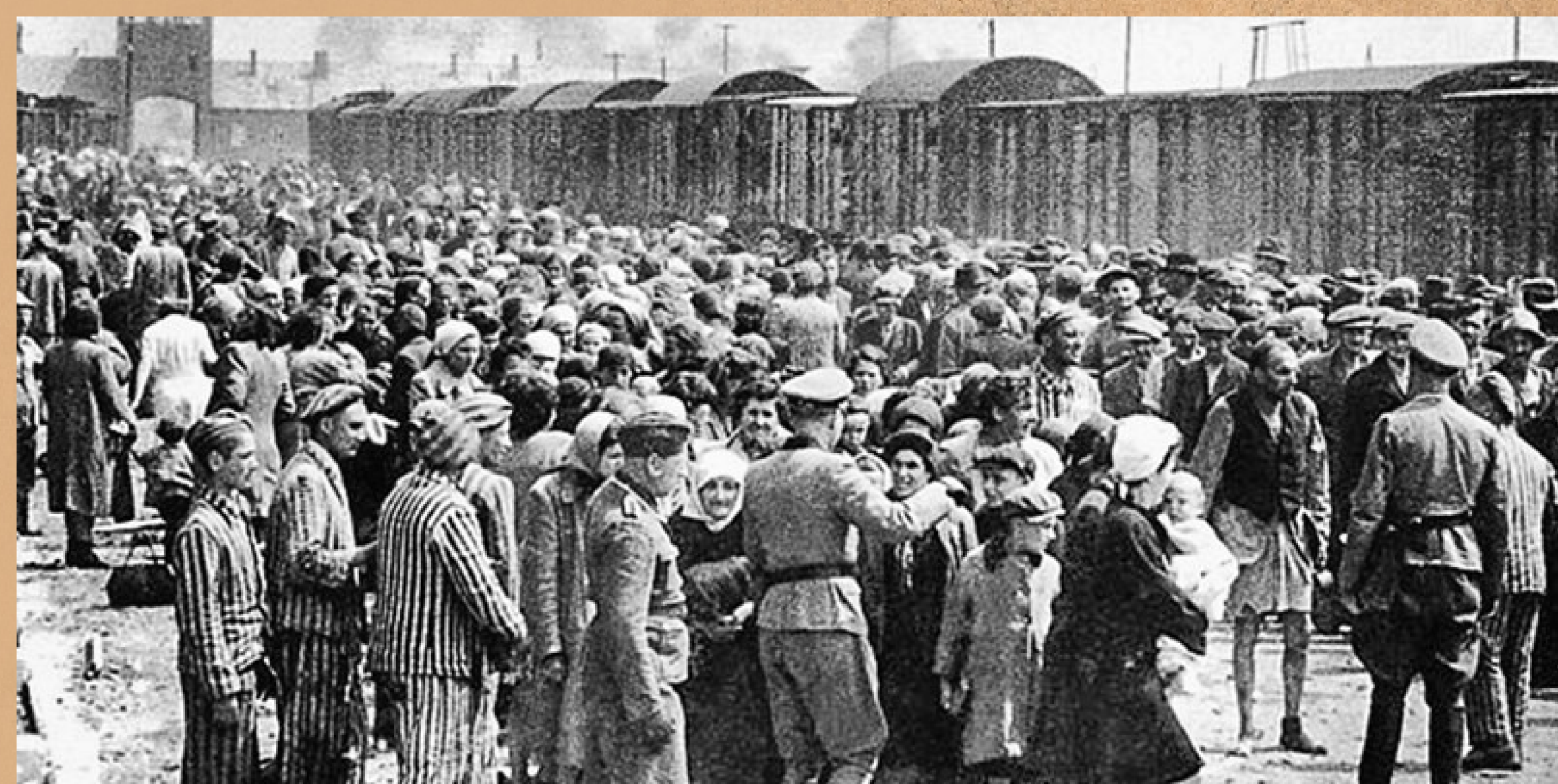
Аушвиц. Селекция. АЦХ

Аушвиц - Биркенау был создан у небольшой деревни Бжезинка. Именно здесь было уничтожено около 900 000 евреев, а также 23 000 цыган.